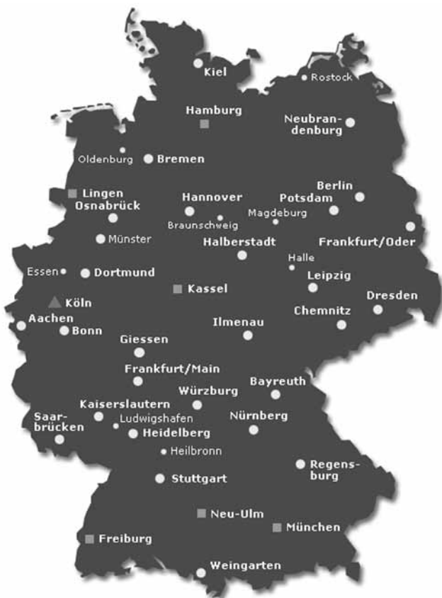
Bild 1 Deutschlandweite Kompetenzzentren des Netzwerks elektronischer Geschäftsverkehr