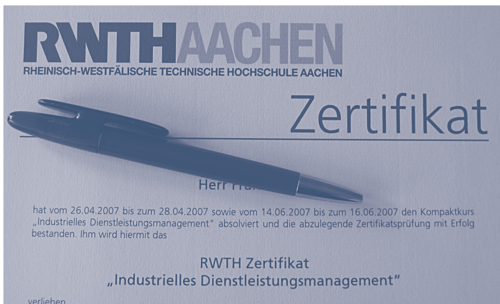
Bild 2 RWTH-Zertifikat „Industrielles Dienstleistungs- management“